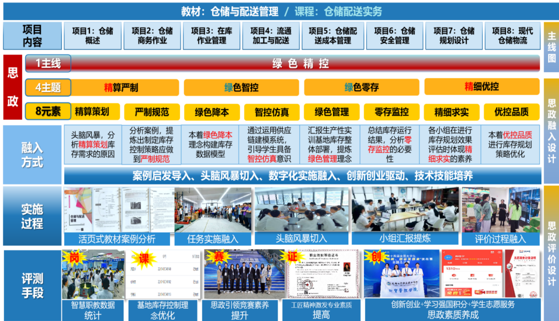
图3 教材首创“1-4-8”数字化课程思政育人体系