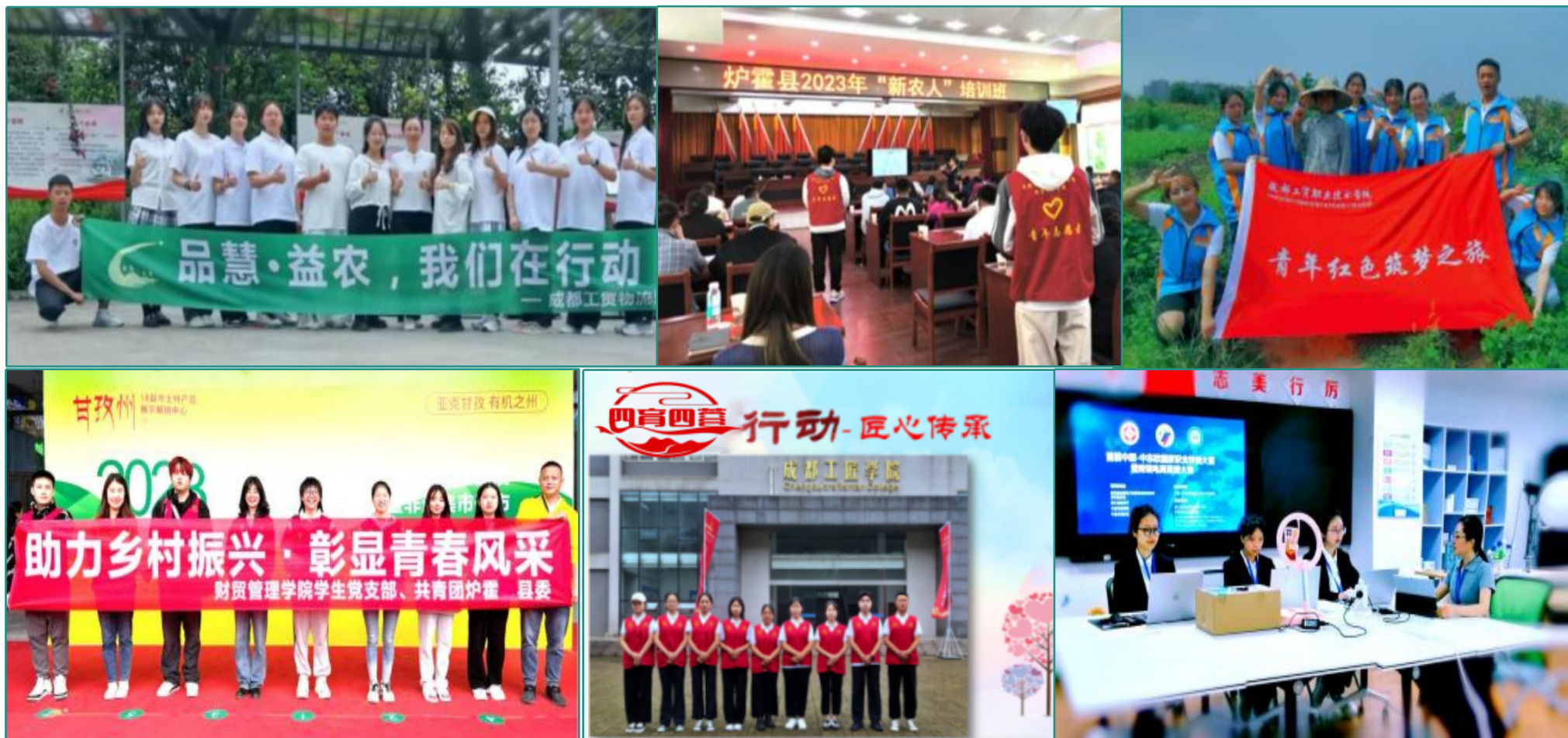
图 1 教材实践应用-思政案例(部分展示)