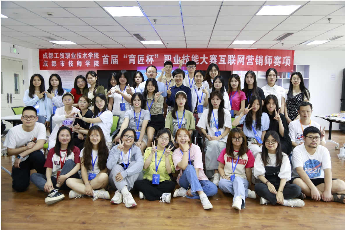
图 5 互联网营销赛项参赛选手合影留念

学校将以此次大赛为契机，强技能、建新功，不断健全完善“全员、全程、全方位”的职业技能竞赛体系，以赛促教、以赛促学、以赛促改，努力培养造就更多高素质技术技能人才。