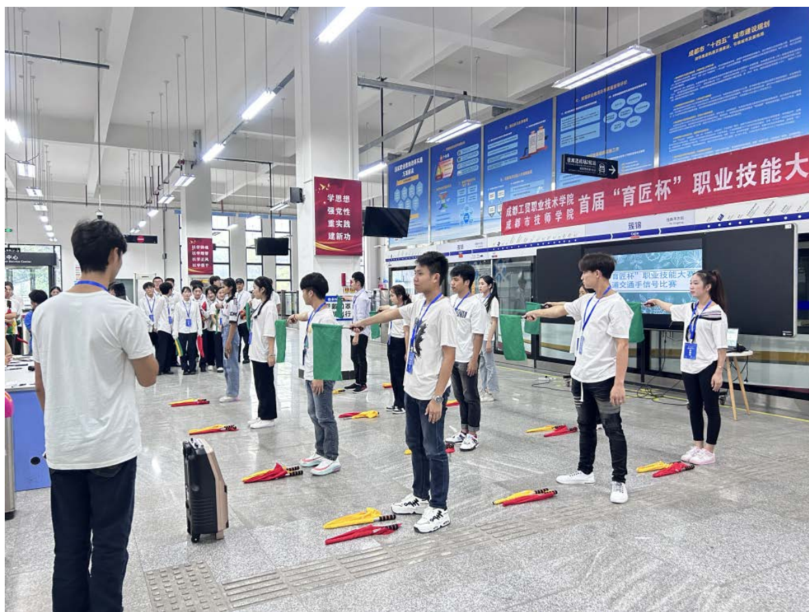
图 1 2022 级老挝留学班学生集体展示手信号指示动作

为深入学习贯彻党的二十大精神和习近平总书记关于技能人才工作重要指示精神，突出技能成才、技能报国，进一步夯实技能人才培养根基，6月15日下午，学校首届“育匠杯”职业技能大赛（决赛）正式举办。学校党委书记王涛，党委委员、副校长王王士星一行亲临现场观摩比赛，教务处处长徐健陪同。